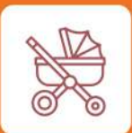
AKCESORIA DLA DZIECI